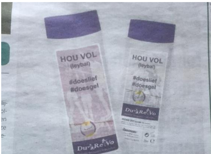
Voor- en achterkant bestelde flesjes.