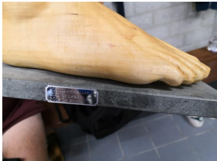
Foto: De laatste prijs door Durevo gewonnen